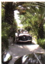
Med Traction Avant til Sardinien. Læs artiklen side 14.