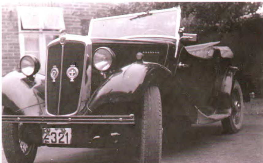
Morris 8 1935