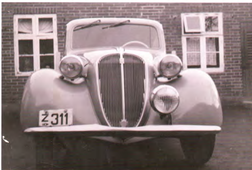
Fiat 508 C 1939