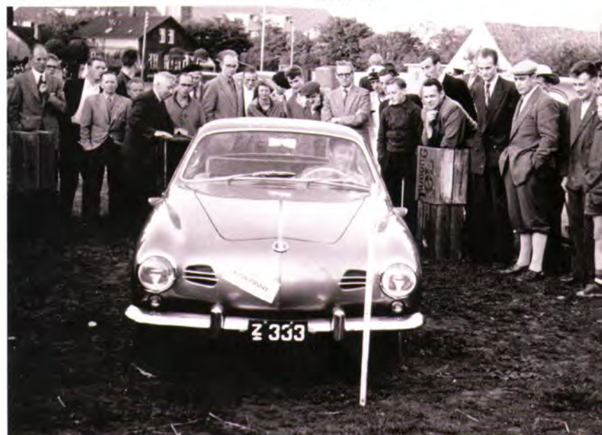
VW Karmann Ghia 1961