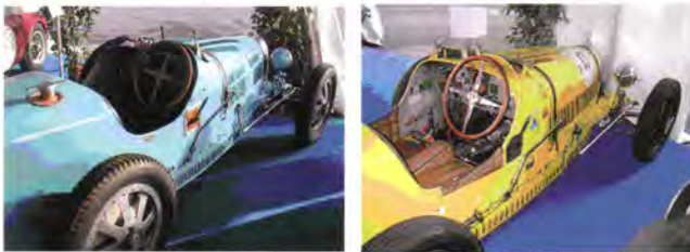
To stk. 1925 Bugatti T35A, 8 cylindre, 1991 cm 3 (en original, en kopi - gæt selv).

Gennem mit arbejde i FIVAs Tekniske Kommission har jeg set mange eksempler på hvordan historien forvansktes. Sedaner optræder pludselig som åbne sportsvogne. Rammer har pludselig ændret længde. Når det går værst til opstår der helt nye kopier af de gamle klassikere.