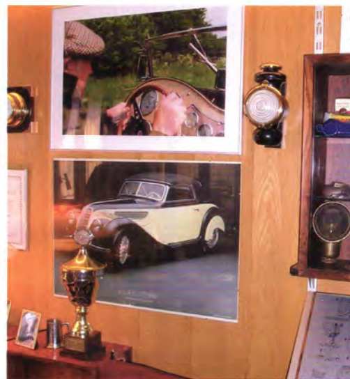
Inspirerende billeder på vægen ved hans skrivebord.