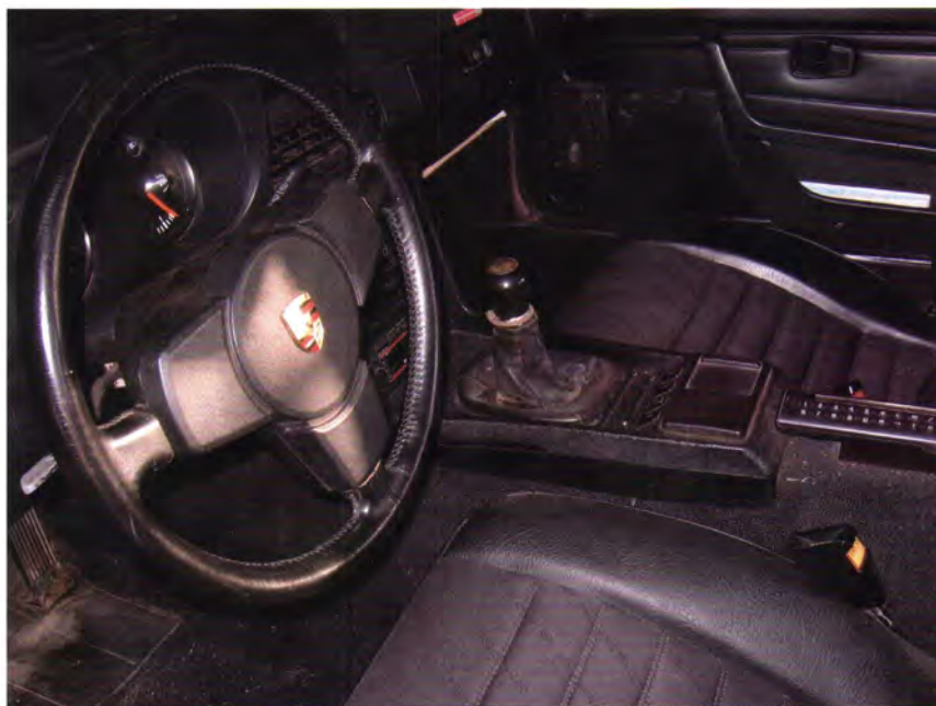
Interiøret var ikke ens fra den ene 924 til den anden 924. Her er sæderne polstret med stof med Porsche-navnet indvævet og kunstlæder på kanterne. NMT telefonen fra Porschs "erhvervsaktive" periode sidder der endnu. Den er faktisk en mobiltelefon, hvis man har kræfter til at bære hoveddelen. Det er minsandten gået stærkt også i den branche. Bemærk rattets lodrette stilling, der kræver et kardanled undervejs (blandt mekanikere kaldet ko-

Min Porsche er nu blevet 31 år og jeg har haft den i 10 år, det meste af tiden som brugsvogn. Ifølge sælgers oplysninger adderet til mit kilometerforbrug, så har bilen kørt cirka 750.000 km og sikkert ikke altid med "blød hat" før mig. Der har i min tid været mest tale om udskiftning af sliddele og herunder en ventilslibning. Så vedligeholdelsesudgifterne har i al væsentlighed mest været præget af dårligt svejsearbejde. Jeg kørte i øvrigt ca. 250.000 km i den før jeg spurgte mig selv om en sådan bil egentlig er udstyret med en tandrem (shame on me!). Jeg har gemt den slidte tandrem (den var i alt fald stort set "tandløs" ), og nærlæst en bestemt side i manualen. I øvrigt vedligeholder jeg bilen hos en mekaniker og laver efterhånden meget lidt selv. Det er til at klare økonomisk og der er ikke problemer med reservedele (der findes også uoriginale og renoverede reservedele). En god brugt 924 er i øvrigt til at betale.