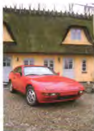
Forsiden: Porsche 924 1976