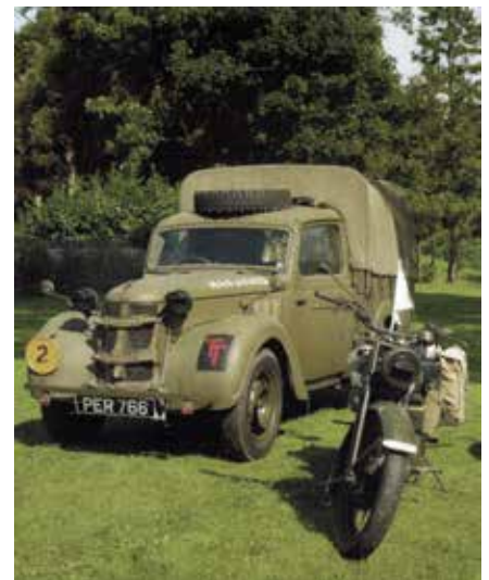
Et bevaret eksemplar af en Austin "Tilly". Motorcyklen ved siden af er en Norton, og det skulle passe.

En helt ny Standard Light Utility, frisk fra fabrikken. Man noterer, at den kendte kølermaskering er ændret til en flad trærist-afskærmning, der er monteret knopdæk på baghjulene, og fælgene er forsynet med flanger, som letter løft under ladning og losning. Den store skive foran er gul, beregnet for en vægtklassificering, for denne type normalt 2.