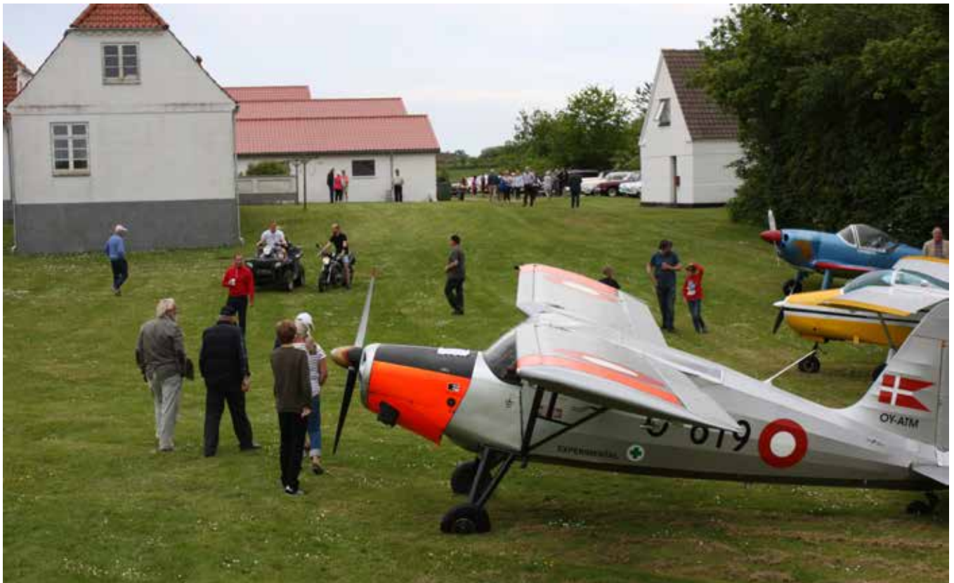
Både fly, veteranbiler, traktorer og motorcykler havde fundet vej til Vanggård i Stenum. Flyet er en KZ-V77 (7) fra 1947, der har været anvendt i flyvevåbnet. Drives nu af en pensionistgruppe på Flyvestation Aalborg.