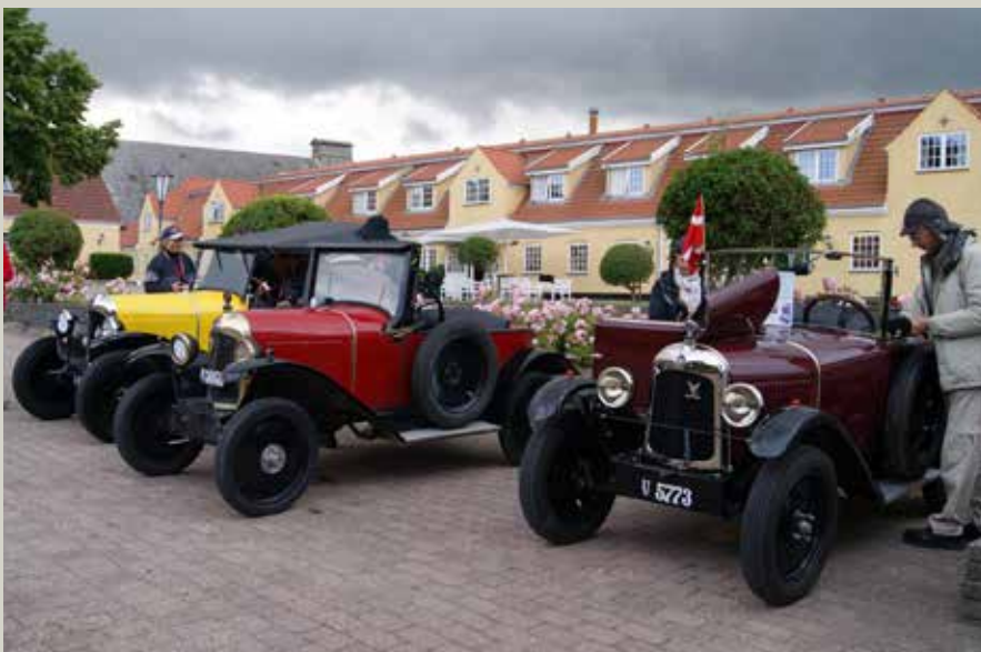
3 stk. Citroën 5HP – 1922 og 2x 1925.