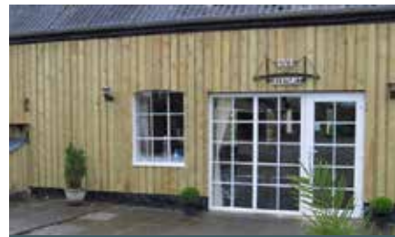
Syddjælland DVK - Lillebælt