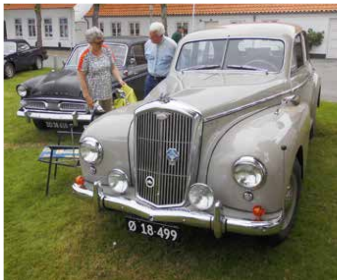
Flot Wolseley Six Eighty. En sjældenhed på vores veje