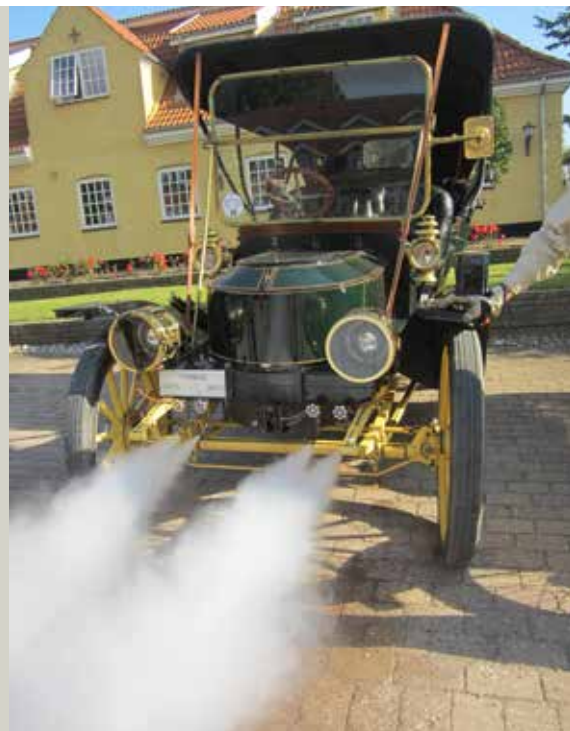
Per Nielsen, Stanley Steamer model 70 fra 1910