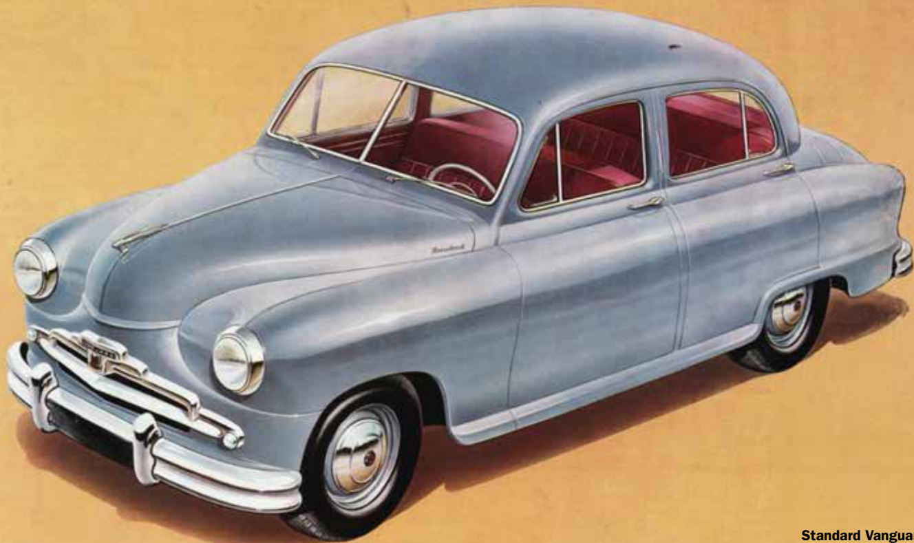
Standard Vanguard (serie 2), 1953-56