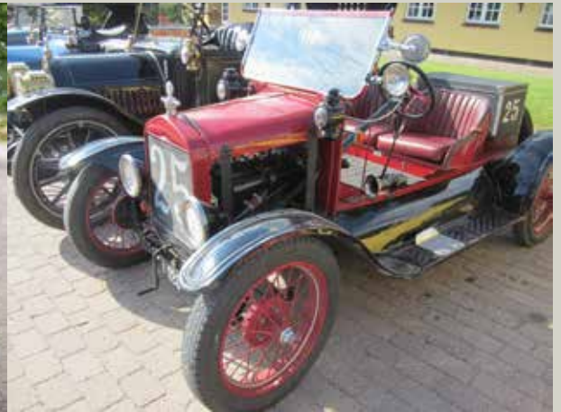
Efter en improviseret pause med dejlig udsigt og god snak, måtte Torben Aggerbeck travstartes. Ford T Speedster, 1925.