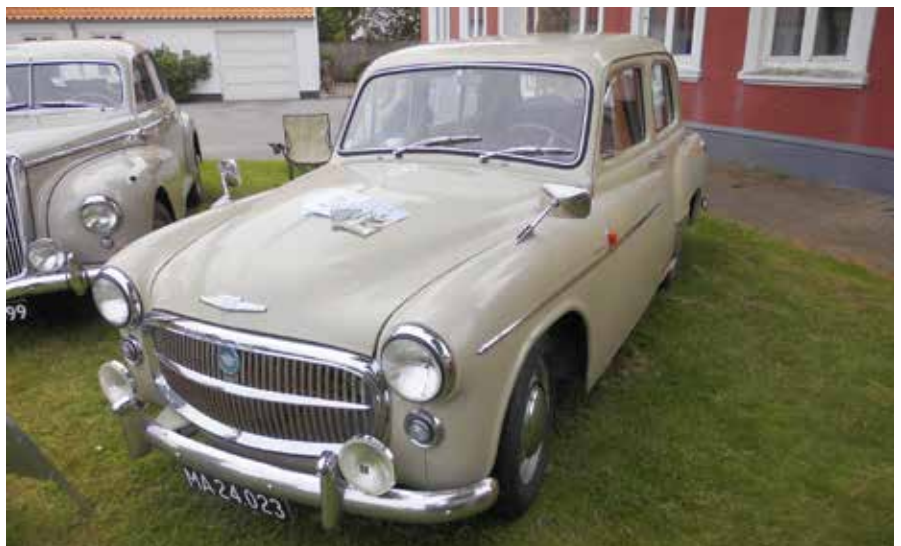
Hillman Minx. I dag et sjældent syn. Dejligt at se så flot et eksemplar på træffet