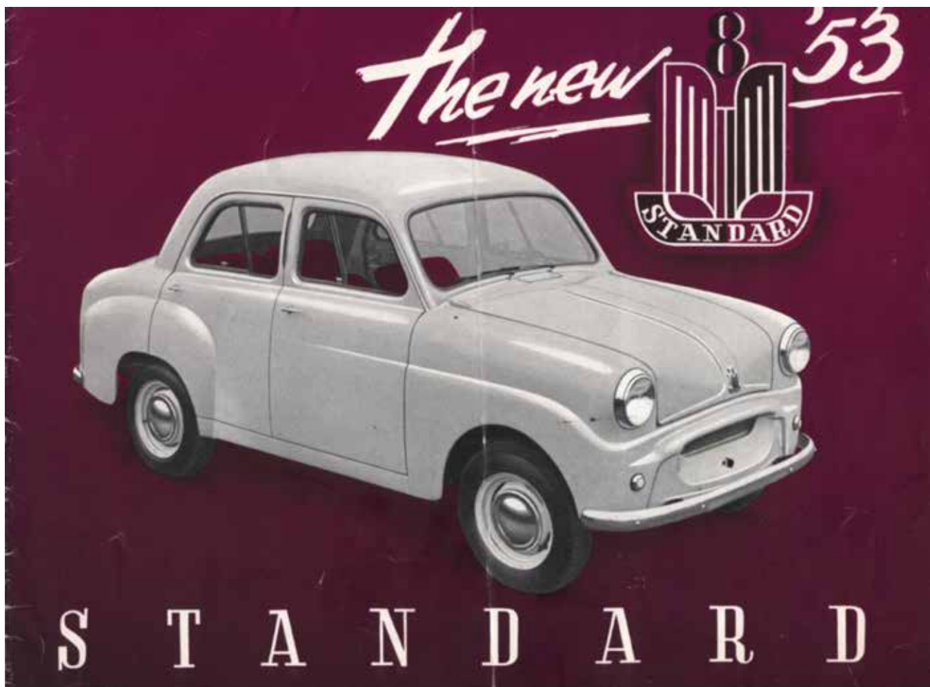
(Dansk) salgsbrochure for Standard 8, 1953.

i begyndelsen af halvtredserne var domineret af Morris Minor, Austin Seven og selvfølgelig de forældede, sideventilede Ford Anglia og Prefect-modeller.