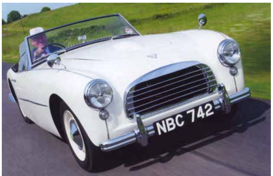
Swallow Doretti 1954