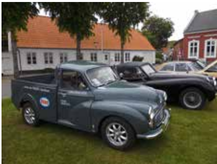
Grejsdalens Esso Service, flot kørende i Morris Minor 1000 Pickup fra 1969. Flot arbejde