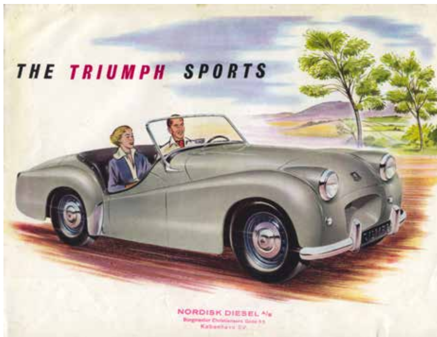
Triumph TR2 – med Vanguard-motoren på 1991 ccm og to SU-karburatorer

guard'ens 85 mm og 2088 cc, men ellers kunne motoren stort set uændret anvendes i traktoren.