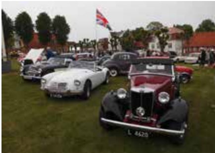
På billedet ses bl.a. en MGA fra 1956, samt en Austin Healey 3000 MK3 årgang 1965