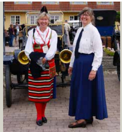
To dejlige damer fra Sverige.