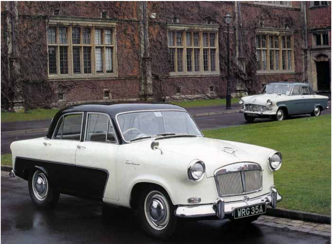
Vanguard serie 3 med selv bærende karrosseri, i varianterne Sportsman og (bagest) Vanguard Six.

Ud fra denne model byggede Belgrove en model i fuld skala til det, der blev Vanguard 3. Samtidig blev det den første Vanguard med selv bærende karrosseri, og nok så vigtigt fik den betydelig bedre adgang til bagsædet end forgængereren havde haft. På den mekaniske side var der helt nyt forhjulsophæng, men ikke de store fornyelser mht. motoren, idet den klassiske Vanguard-motor fortsatte stort set uændret i den nye model.