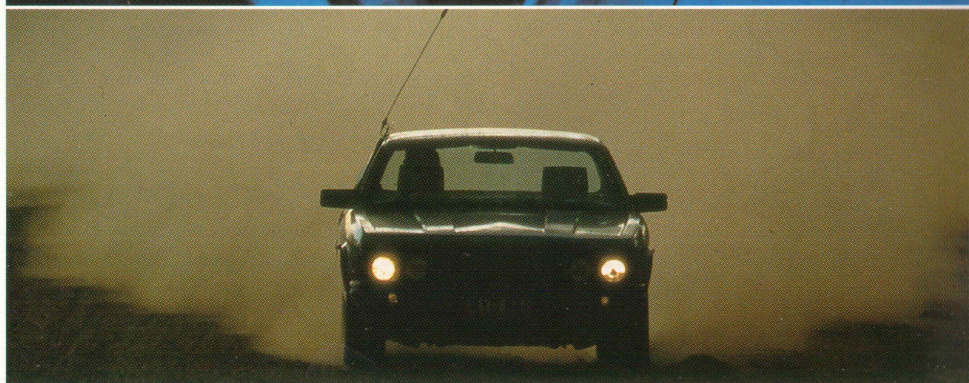
Over 8 mill. km verdensomspændende testkørsel.

af alle de traditionelle dyder. Valnød-finéren er individuelt sammensat og parret. Sæderne er håndsnyede. Læderet er omhyggeligt udvalgt efter kvalitet og farvedybde.