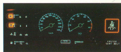
Traditionel instrumentering og ny teknologi.

Sovereign og Daimler-versionerne har endvidere lastafhængig niveauregulering samt ABS bremses som standard.