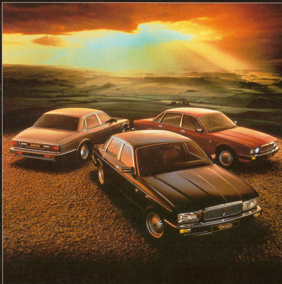
Den nye serie af Jaguarer: Sovereign, Daimler og XJ6.