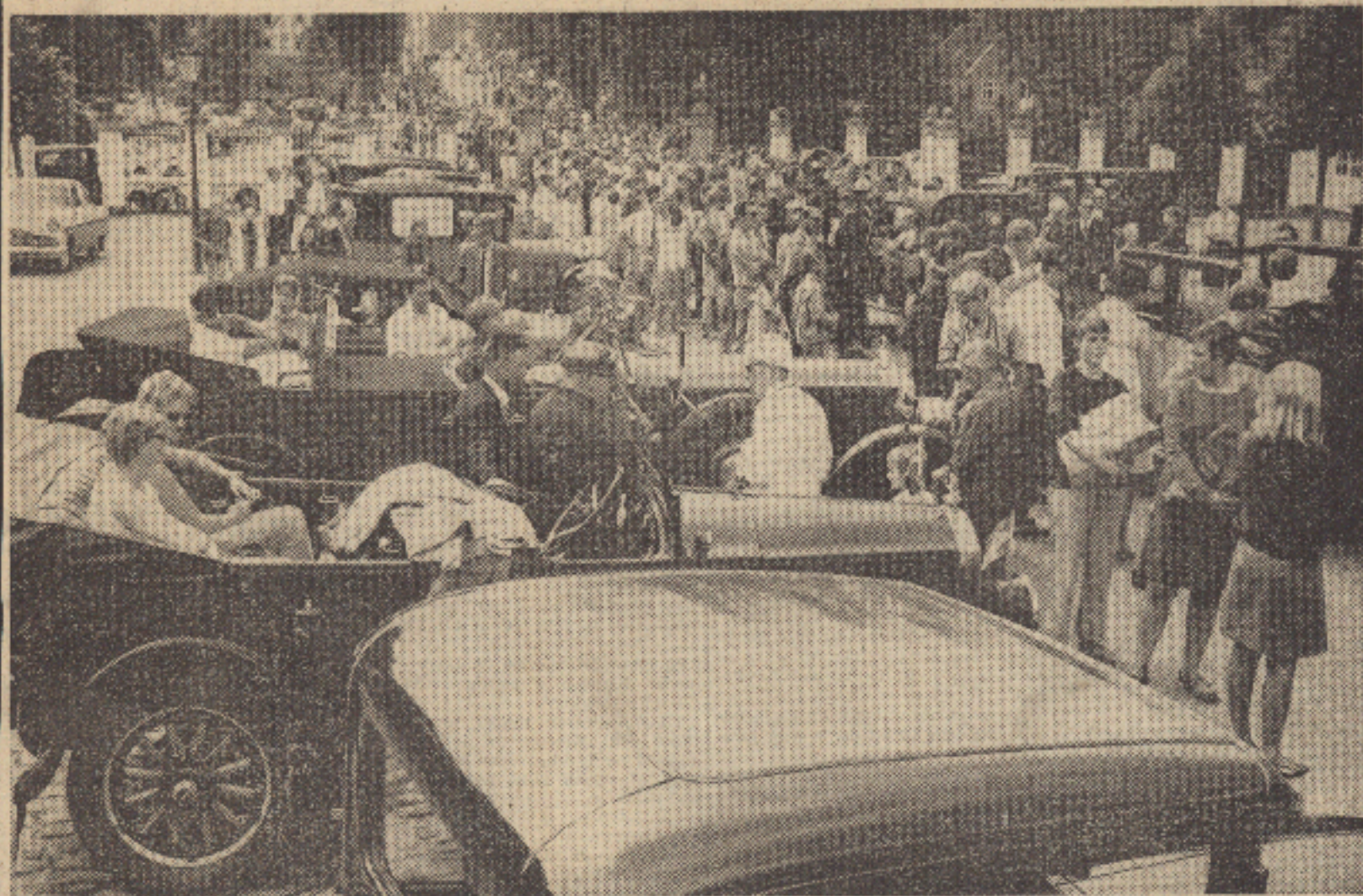
Pladsen foran Fredensborg Slot var så fyldt, at veteranerne knap kunne nå frem til startstedet, og flere trængtes langs ruten.